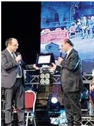
CANZONI L'ultima edizione