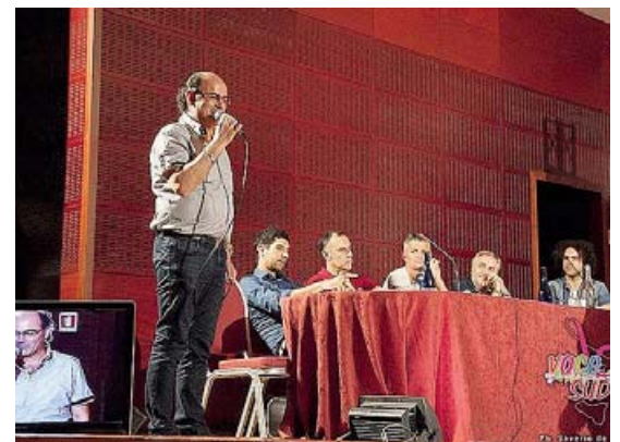
UNA VOCE PER IL SUD La giuria