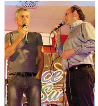
Un momento del workshop